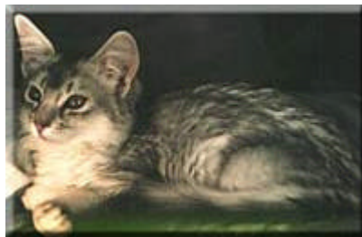
Feli-Fee's Silver Celia blue-silver

Trotz edelstem Äußeren ist jedoch der Charakter der Somali noch bemerkenswerter. Überaus menschenbezogen und verschmust braucht sie die uneingeschränkte Zuwendung "ihrer" Menschen. Lebhaft und verspielt bis ins hohe Alter ist die Somali ein vollwertiges Mitglied ihrer Familie. Falls ihre Menschen weniger Zeit haben, braucht sie am besten ein Geschwisterchen zum Spielen. Sie verträgt sich nicht mit anderen sehr dominanten Katzen. Oft etwas eifersüchtig, zieht sie sich dann zurück und trauert, ja sie kann sogar krank werden. Hat sie sich an einen Menschen gebunden, bringt sie ihm ein Leben lang uneingeschränkte Liebe und Vertrauen entgegen.