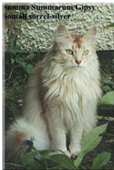
Summa Summarum Gipsy Kastratin sorrel-silver

Das halblanghaarige Fell soll dicht und weich sein. Ein längerer Kragen um den Hals und "Höschen" an den Beinen sind erwünscht.