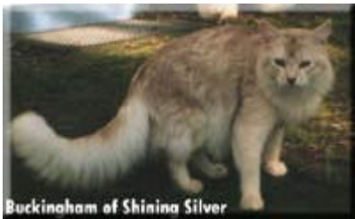
Buckingham of Shining Silver sorrel-silver

Alle diese Farben gibt es auch auf Silberuntergrund, d.h. die jeweilige Farbe der Bänderung auf einem hellen Silberweiß: Blacksilver, Bluesilver, Sorrelsilver, Fawnsilver. Neuzüchtungen auch in Lilac und Chocolate.