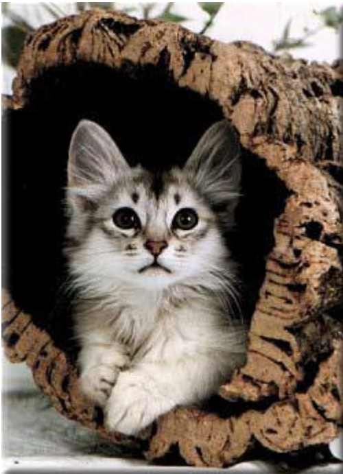
Coco von Babylon schwarz-silber

Aus der traditionsreichen Stammmasse der Abessinier entwickelt sich die halblanghaarige Somali, die mittlerweile die Abessinierkatze an Beliebtheit in den Schatten stellt.